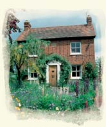
Das Bach Centre Mount Vernon

Der Einsatz von Bach-Blüten in der Praxis unterliegt nationalen Gesetzen und Regelungen. Wir informieren Sie gern.