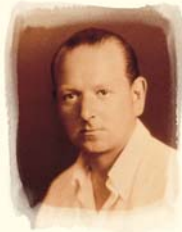
Dr. Edward Bach (1886-1936)

In den 1930er Jahren entdeckte der englische Arzt und Homöopath Dr. Edward Bach wild wachsende Pflanzen, die sich positiv auf emotional belastende Zustände, wie z. B. Angst oder Ungeduld, auswirken. Es gelang ihm, aus 37 Pflanzen und Quellwasser ein einfaches, sicheres und ganzheitliches System zu entwickeln, das leicht verständlich und nebenwirkungsfrei einsetzbar ist.