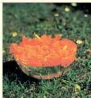
Herstellung der Muttertinktur (Sonnenmethode)